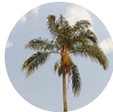
Palmera Pindó | Queen Palm

- Fruit: drupaceous, ovoid, fibrous, up to 1-inch long, orange when ripe. Edible. Each infructescence can weigh several kilos when the fruits are ripe, acquiring a pendulous disposition on the plant.