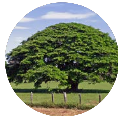
Tombó | Pacara Earpod Tree