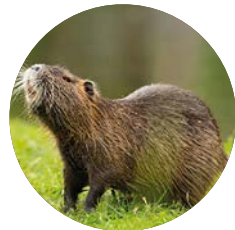
Nutria | Otter

Nutrias have very good hearing, although it is not adapted to underwater orientation; their sense of smell is also very acute. Touch is also very sensitive, especially the long and striking facial vibrissae on the muzzle, mouth, chin and palps. Sight is adapted to function both in and out of the water, with slightly spherical eye lenses.