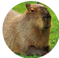
Carpincho | Capybara

It is a largely distributed species, with no conservation issues. However, their population has decreased in certain regions due to the heavy hunting pressure for consumption of their meat and the use of their leather. Infectious and parasitic diseases often affect their populations. In some areas, such as the south of the province of Buenos Aires, its distribution has spread.