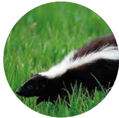
Molina's hog-nosed skunk

They have solitary nocturnal and/or crepuscular habits. Their diet is generalist and opportunistic, eating mainly insects and small vertebrates, although they prefer beetles. Southern lapwings have a typical defensive behavior, recognizable due to its smell. In circumstances of threat or alert, after issuing several warnings, they are capable of discharging their perianal glands.