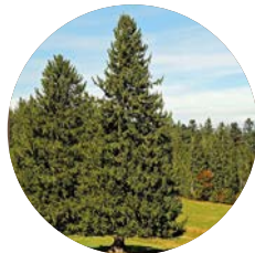
Pino | Pines

These are trees that can reach up to 98 ft. in height, with a straight trunk on which several tiers of branches are arranged horizontally. The crown is usually pyramidal, although in older specimens this shape is lost. The male cones are ovoid or cylindrical in shape, with helically arranged scales and two pollen sacs each. The female cones are of variable size that at maturity become lignified and can reach a large size (pine cones), have helical scales with two seminal primordia. The seeds are usually winged and are sometimes edible (pine nuts).