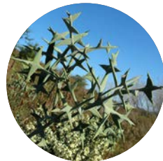
Espina de la Cruz | Anchor Plant

- Distribution: Argentina, Brazil, and Uruguay.