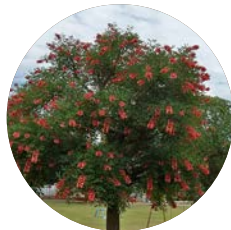
Ceibo | Cockspur Coral Tree

- Flowers: red, large, and fleshy, 1 to 2.4 in., arranged in clusters along the extremity of the twigs, pedicellate. Flowers from November to February.