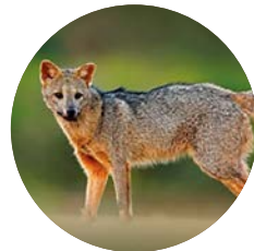
Zorro | Pampas Fox

Nocturnal and crepuscular habits. They hunt alone or in pairs. Their diet is omnivorous and variable throughout the year, i.e. since they take advantage of the availability of food resources in each season. This includes fruit, insects, crustaceans, amphibians, birds, small mammals, and carrion.