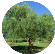
Anacahuita | Cordia Boissieri