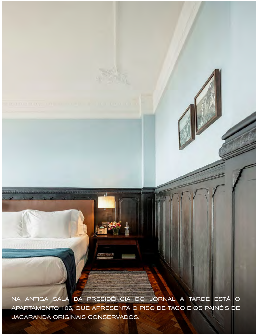
NA ANTIGA SALA DA PRESIDÊNCIA DO JORNAL A TARDE ESTÁ O APARTAMENTO 106, QUE APRESENTA O PISO DE TACO E OS PAINÉIS DE JACARANDÁ ORIGINAIS CONSERVADOS.