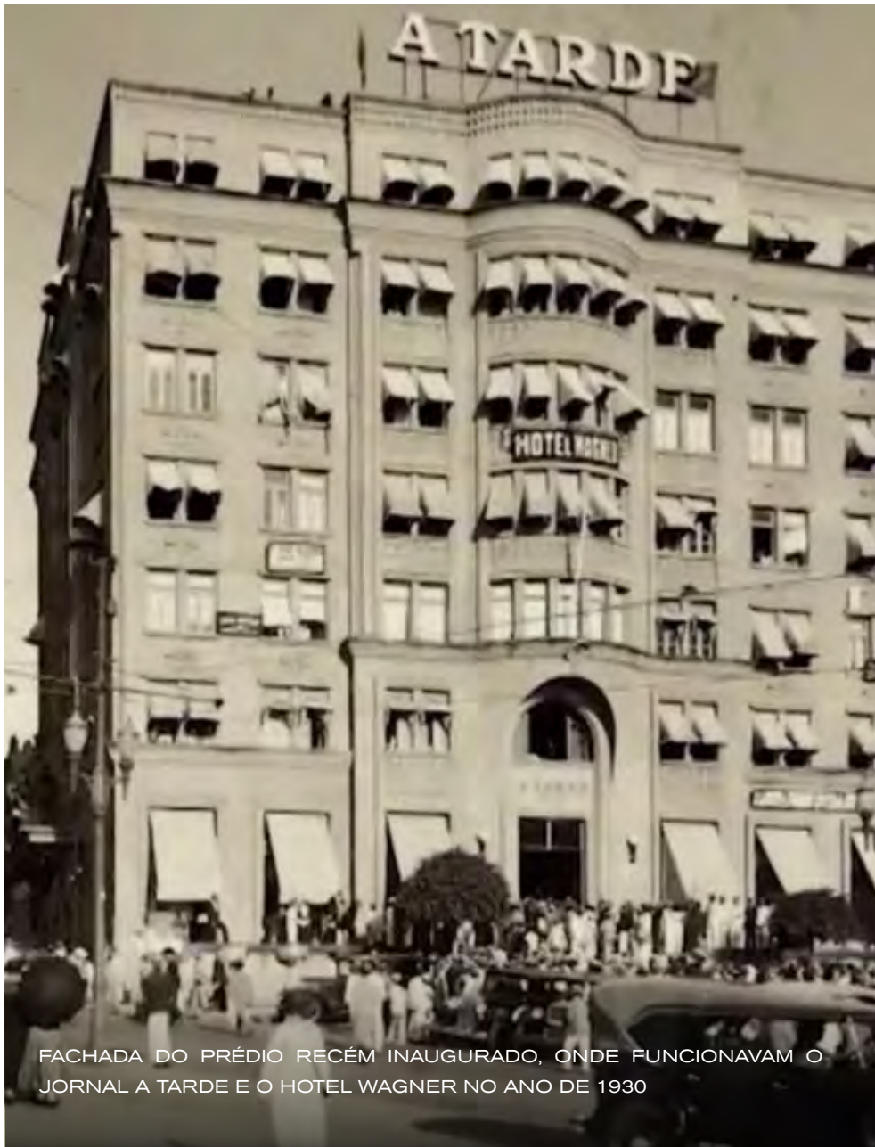
FACHADA DO PRÉDIO RECÉM INAUGURADO, ONDE FUNCIONAVAM O JORNAL A TARDE E O HOTEL WAGNER NO ANO DE 1930